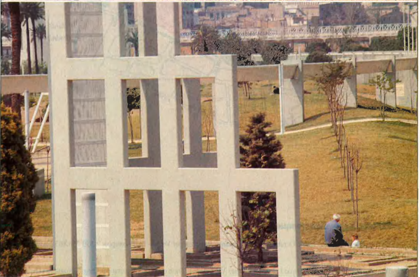
Bofill, tan bon arquitecte com publicista. Un parc urba forestal realment singular.

ment la maqueta de Bofill o si, senzillament, es va deixar convèncer per la primera proposta coherent, amb tota l'operació de marketing que l'envoltava, que se li presentà davant.