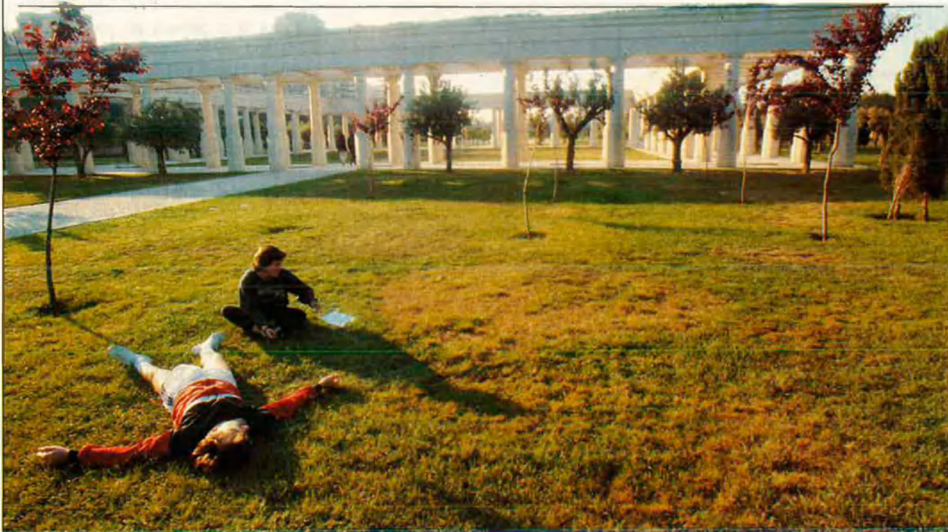
Malgrat tot, València vol el seu riu