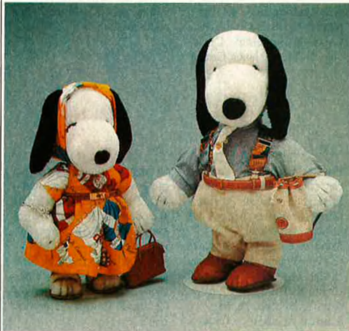
Snoopy en versió d'Hermès. +