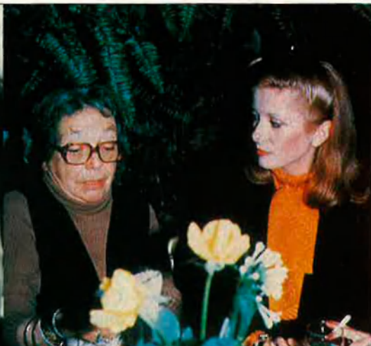
Catherine Deneuve va passar per Canal 9.