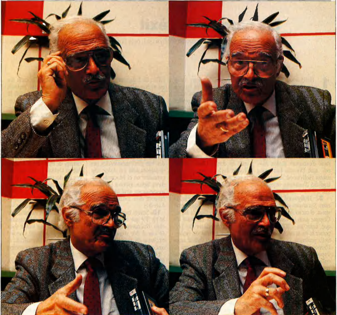
L'obra de Rovira Beleta va lligada a dos títols moll significatius del cinema: El amor brujo i Los tarantos .