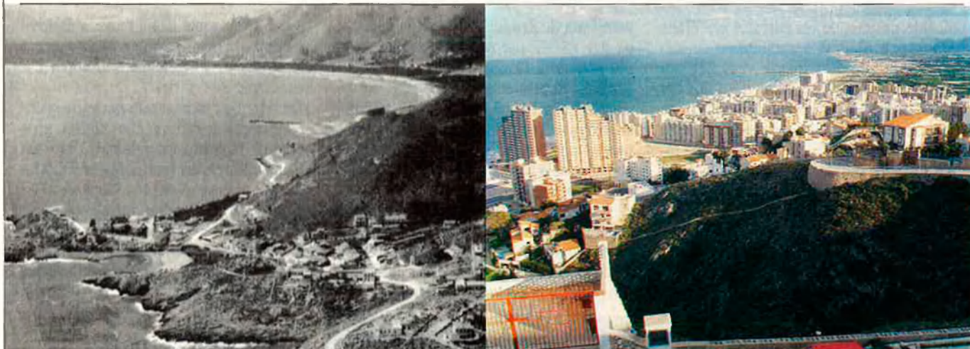
Cullera, abans i després; panorama de l'especulació salvatge.