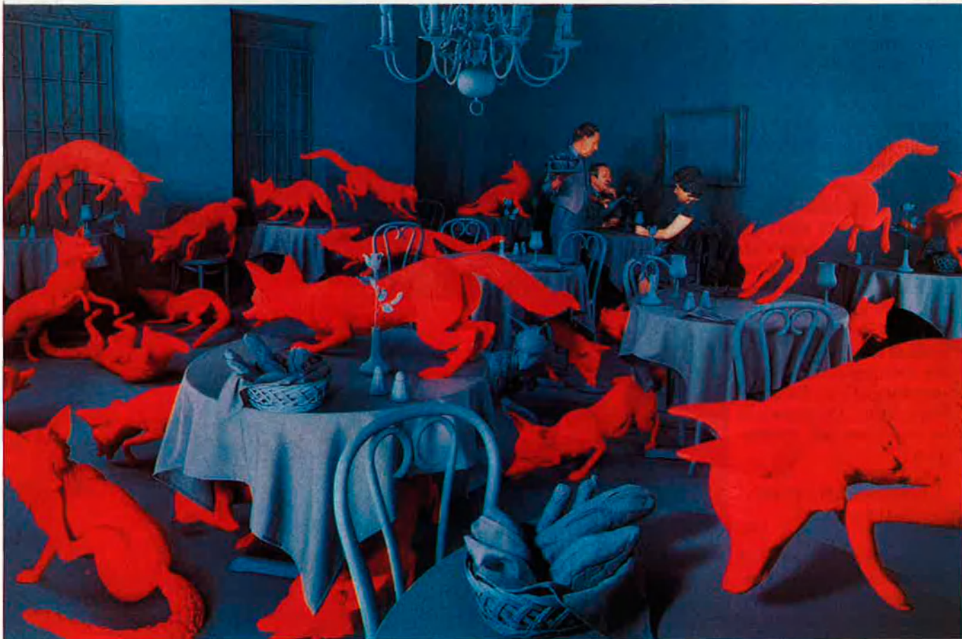
"Fox Game". 1989.

Del 23 d'abril i fins al 31 de maig, nombroses exposicions i activitats fotogràfiques transformaran l'àmbit cultural i artístic d'aquesta primavera, en un festival sense precedents.