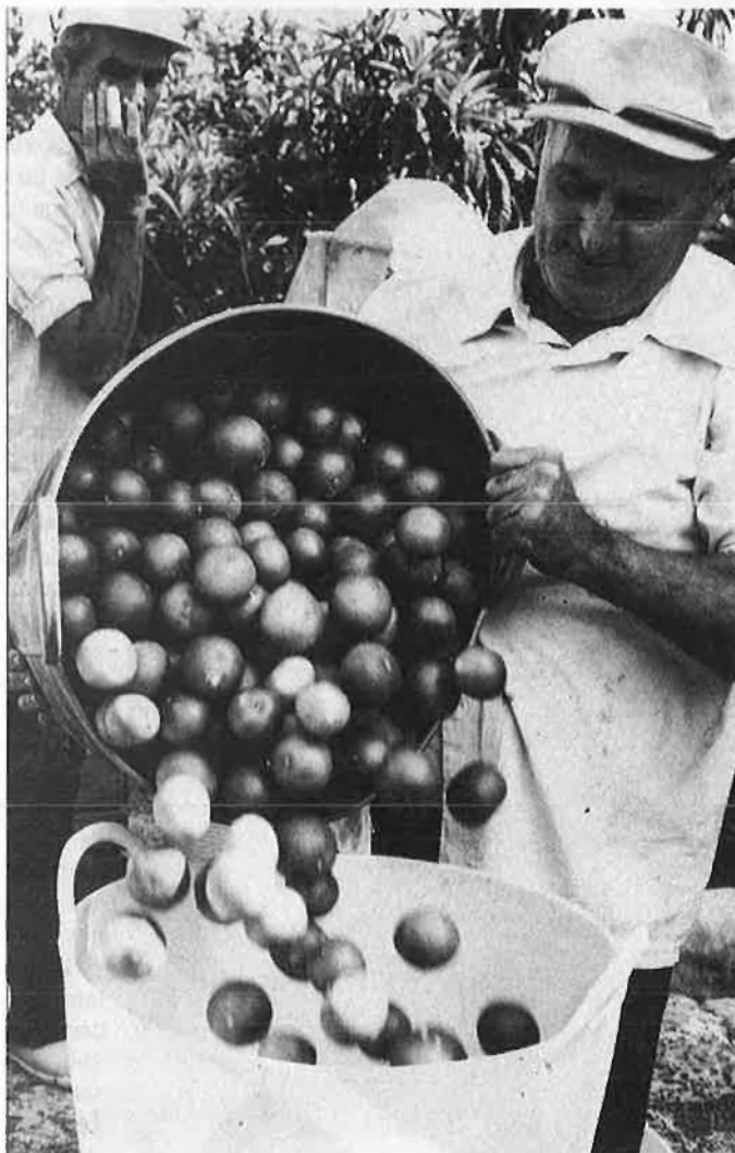
El llaurador perd, el corredor guanya i l'industrial es beneficia.

La finalitat última d'aquestes normatives és fomentar temporalment la transformació de cítrics en suc i grills i promoure que els llauradors destinen les seues collites a