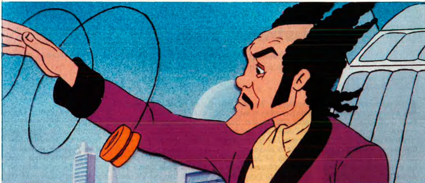
Els atzarosos són personatges que s'alimenten de les rialles que l'home els provoca quan cau en algun error.

formant-se en un immens parc d'atraccions que acabarà amb l'avorriment de la tecnificació".