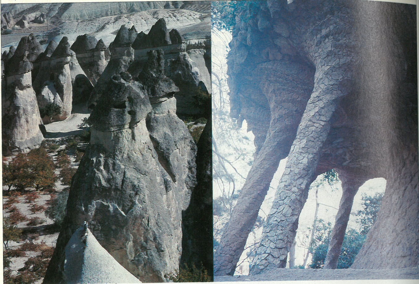
Les imatges de la Vall de les Xemeneies del Parc Güell parlen per elles mateixes.

(plenes de grutes, columnes, escales helicoidals, finestres i voltes hiperbòliques, pilars inclinats, plantes curvilínies, torres i arcs de perfils parabòlics, portes de perfil catenàric, façanes ondulades i xemeneies de formes insòlites) ens portin, de sobte, al mig d'una enorme meseta emmarcada per dos vells volcans –l'Erciyes Dagi i el Hasan Dagi–, reponsables –diuen– del material allí perforat.