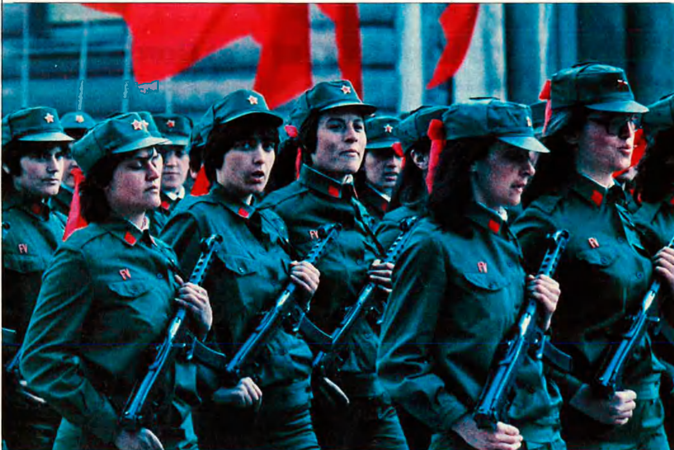
Albània, juntament a Cuba i Corea del Nord, últims bastions de l'ortodoxia.