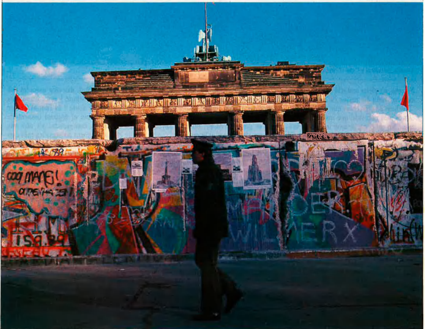
El mur que separava l'Est de l'Oest sembla desplaçat a l'eix Nord-Sud.

doble xantatge: "Ajuda'm, Occident. Després d'haver explotat els meus recursos... m'ho ben deus. O, si no, m'aproparé a veure què diuen els soviètics". La resposta corre el risc de ser: "Primer que res, ajuda't tu mateix". El ministre algerià d'Afers Estrangers, Sid Ahmed Ghazali, ha comprès ben aviat que l'interès no dissimulat de l'Europa de l'Oest per l'altra