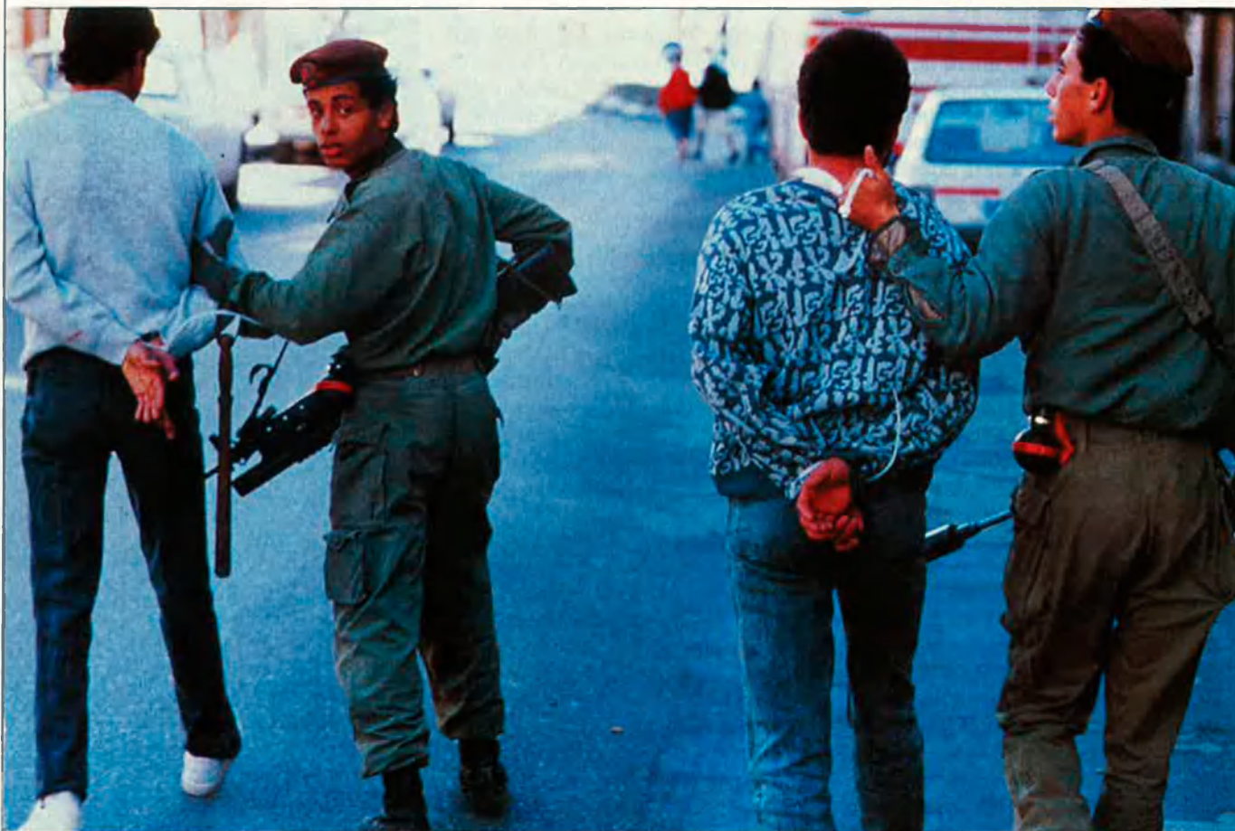
Israel esdevindrà per als EUA una aliat menys important estratègicament.

trangers dels dotze, amb perfecta desimboltura respecte als 22 convidats àrabs, entre els quals el rei Hassan II de Marroc, es posen immediatament d'acord, fora de la reunió, per a atorgar una ajuda immediata a Romania. El president Mitterand hagué d'aprofitar tots els recursos -afortunadament inesgotables- de la seua eloqüència per a convèncer el món àrab, al final de la sessió, que "l'apropament de les dues Europes, separades massa temps, no es farà a costa de les solidaritats i els lligams de tota mena que uneixen els dotze amb els veïns àrabs i amb els altres veïns". A més, afegia: "El suport a l'Est representarà per a nosaltres una addició, no una substracció". I uns dies després: "No sempre és fàcil".