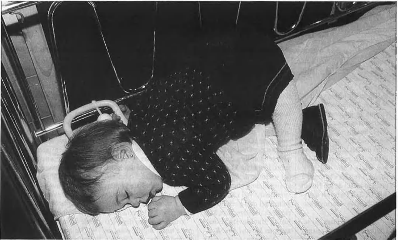
Els psicòlegs no es posen d'acord sobre les repercussions del nou ritme de vida en els xiquets.

els petits, sempre es pot recórrer a les classes d'anglès, de dansa o de judo, per posar uns exemples. També en aquesta matèria han aflorat tot un seguit d'empreses que ofereixen cursos de tota mena per tal de mantenir els xiquets entretinguts en les franques horàries que van des de les sis de la vesprada, que és el moment en què tornen d'escola, fins a les vuit de la nit, hora en què els pares poden tornar a fer-se'n càrrec. La millor solució consisteix a dur els nens tres vegades a la setmana al gimnàs i dues vegades més a la classe d'anglès.