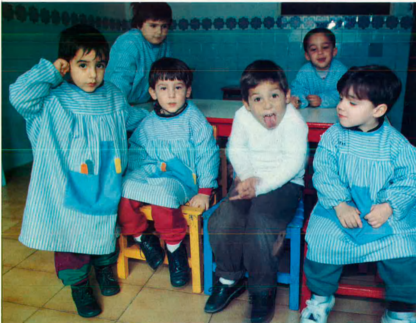
Els xiquets passen en les guarderies la major part del dia.

El canvi que està experimentant la nostra societat i en conseqüència la família, ha fet aflorar tot un negoci cada vegada més especialitzat al voltant del que de sempre ha estat considerat el rei de la casa.