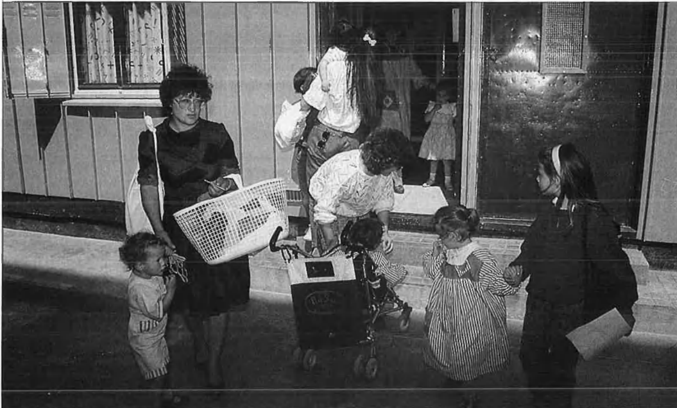
De vegades, la vida dels nens es converteix en una dura jornada laboral.

nostra societat i, en conseqüència, la família, ha fet aflorar tot un negoci cada vegada més especialitzat al voltant dels més menuts. Amb una mica de sort un nadó podrà passar sense massa obstacles unes 16 setmanes seguides amb la mare o el pare, ja que aquest és el temps d'excedència que preveu la llei per a superar el tràngol de la maternitat. El retorn al treball de la mare representa deixar el xiquet en mans de l'àvia o la minyona o el que és més freqüent, en una guarderia.