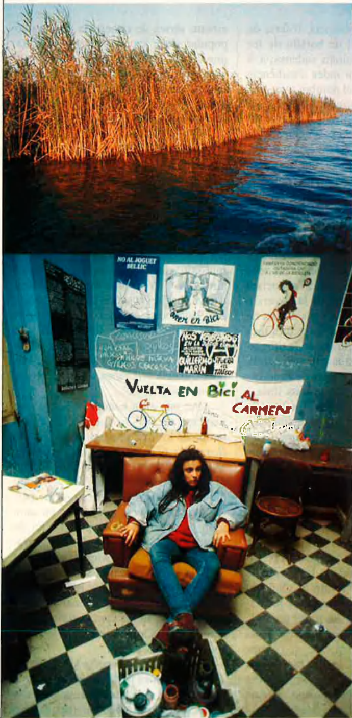
L'Albufera, sense protecció. Baix, Palma 5, s'ha quedat buit.