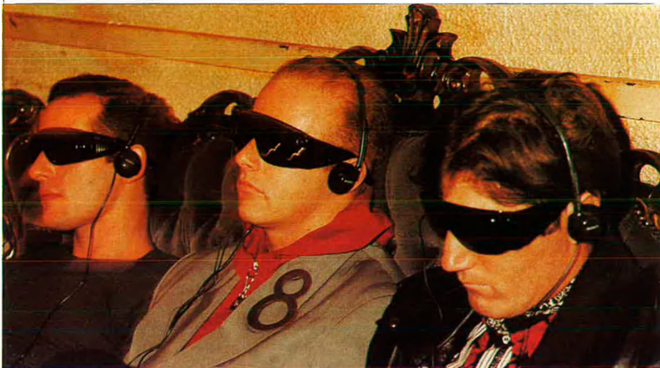
La Nova Era ha quallat particularment en el món de la música. Una musica, síntesi entre orient i occident, que propicia el relax.