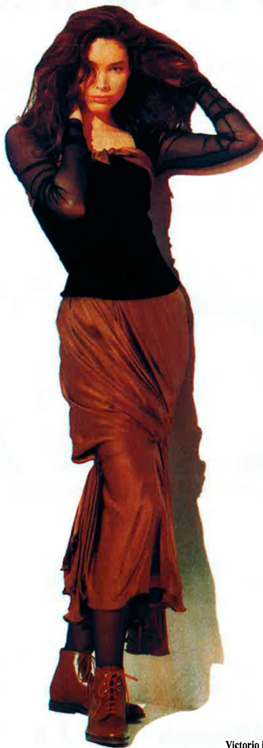
Victorio i Lucchino.

Cal reconèixer-ho. La Moda d'Espanya, inclús la subvencionada, resulta molt cara. Però si no és l'espanyola serà l'europea i, per a les butxaques amb menys possibilitats, la moda prompta, la que tornarà a entonar el cos i l'ànim l'hivern que ve tant o més que la gimnàstica, les vitamines, el sexe o el ginseng. De la moda, es diga el que es diga, no es pot passar, si no és que un o una renuncia a mirar-se a l'espill i a agradar. La moda arrossega perquè té com aliades dues armes juga-