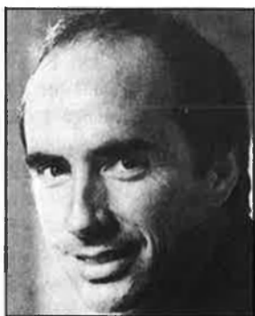
El cant de l'enyor