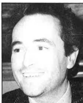
Et portaré una rosa