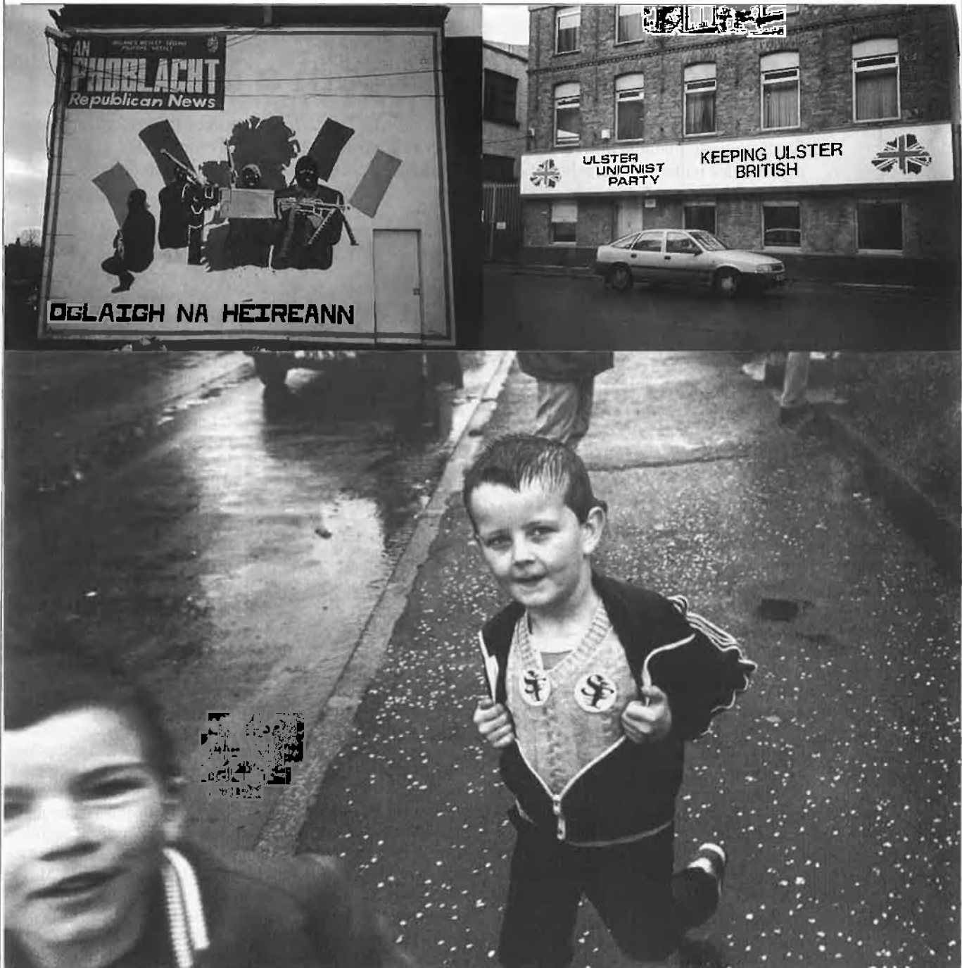
Veïns enfrontats: les seus socials de Sinn Fein (esquerra) i la Unionist Party (dreta), la sucursal d'Anglaterra. (baix) Maduració política precoç.

Birmingham Six i abans sobre temes de discriminació i sobre l'ús indiscriminat de les bales de plàstic. Però no han dit res sobre la situació general, consideren que és un assumpte intern del govern del Regne Unit.