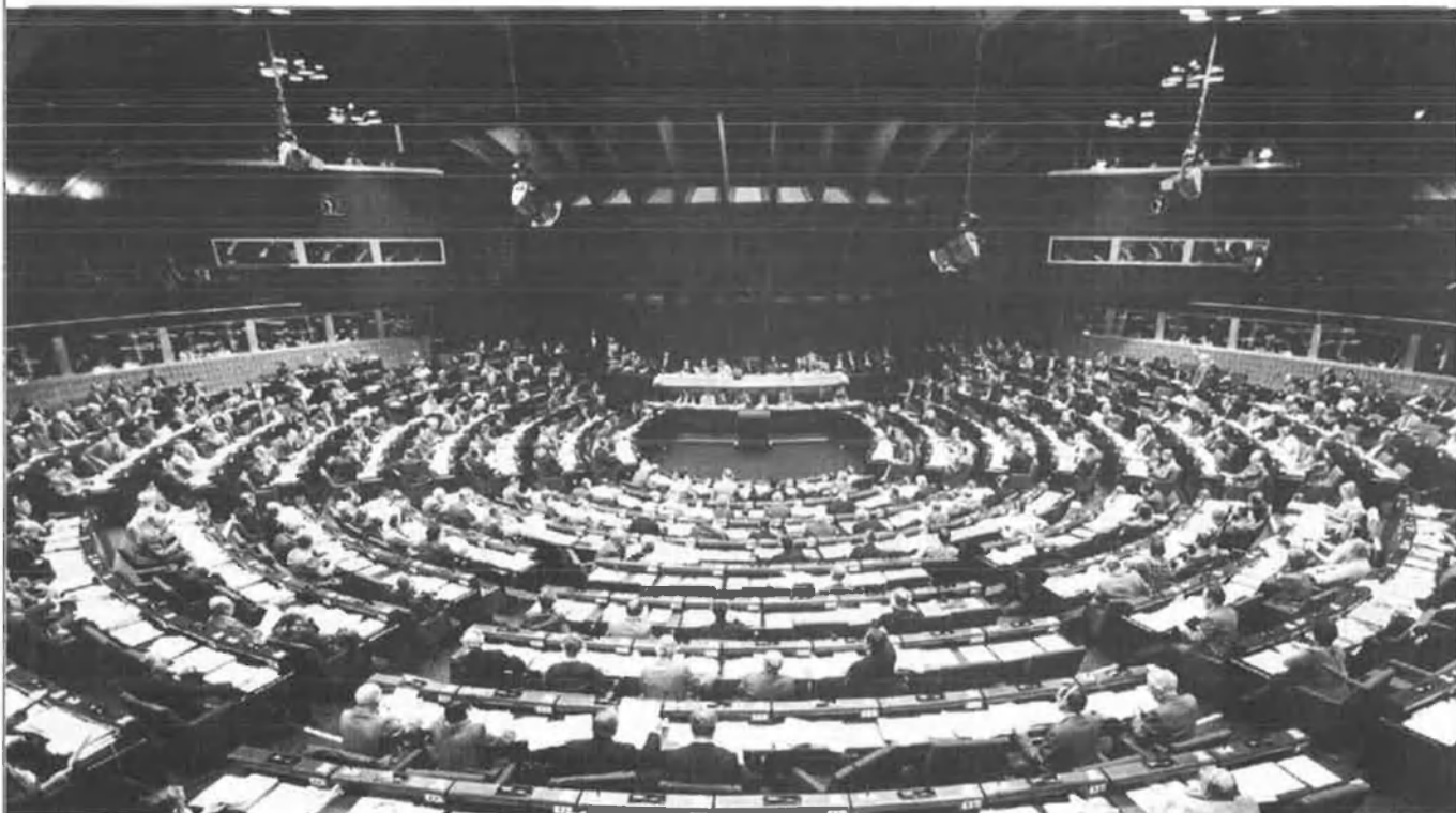
Alguns creuen que la cessió de sobirania dels estats europeus a Brussel·les provocarà l'afebliment d'aquests.

Europa hi ha molt poques Bretanyes i moltes Alsàcies. Alsàcia no seria entitat nacional per ella mateixa sinó com a part del món germànic. Aquesta desadequació de fronteres arriba al seu paroxisme a l'est.