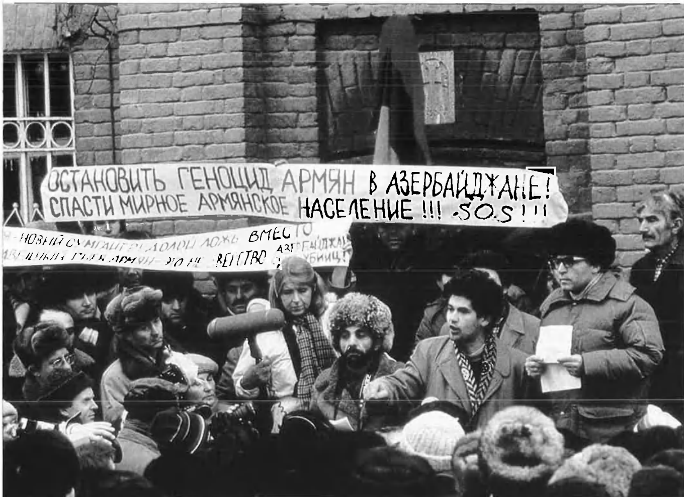
Manifestació armènia en petició que les seues fronteres siguen modificades.

a formar agrupacions subregionals, però supranacionals, continuarà i que Europa Occidental retindrà un sentit d'identitat i destí comú. La por al domini soviètic serà substituïda per la necessitat de formar un nucli estable al voltant del qual es puga organitzar la nova Europa. He anomenat aquest nucli, potser tendenciosament, "els Estats Units d'Europa Occidental" i he suposat que haurà d'incloure com a mínim la nova Alemanya unida a més de França, Itàlia i els països del Benelux. Els països perifèrics de l'actual Comunitat Europea seran més dubtosos, però sospite que, en última instància, ni Espanya ni Gran Bretanya podran acceptar la idea d'una nova fase de la construcció europea, que va endavant sense ells i que aquests interessos implicaran els països geogràficament darrere d'ells, és a dir, Portugal i Irlanda.