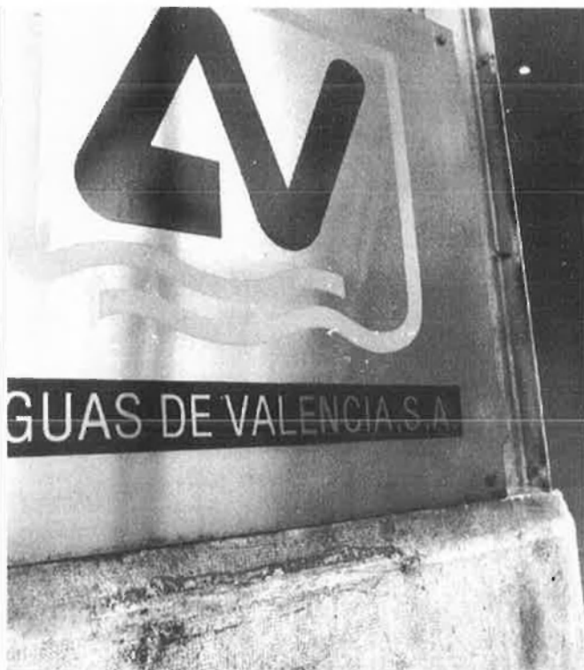
Unes accions que han duplicat en 13 mesos el seu valor.

SAUR s'ha convertit, així, en el segon accionista de l'empresa, ja que el paquet adquirit representa un 14'36% del capital de la societat. El primer és la societat Aigües de Barcelona, amb un 25'9 de les accions, i el tercer el Banc Central, amb un 10%. Però, al seu torn,