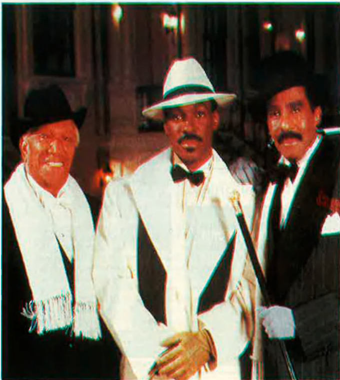
"Tinc clar que he perdut l'oportunitat que algun dia em nominen per a un oscar".

L'oportunitat cinematogràfica no es faria esperar, i