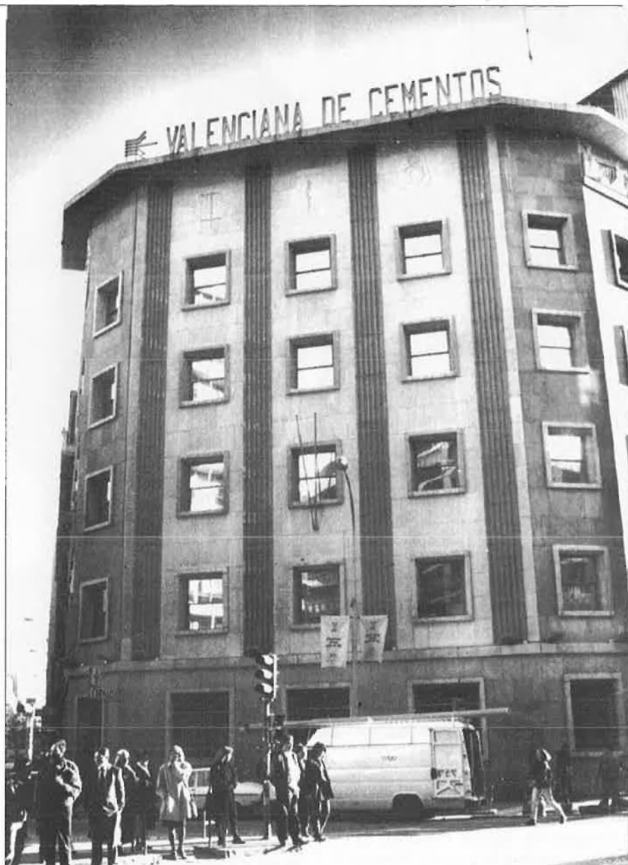
En els somnis de Mario Conde, Valenciana de Cementos ha fet del ciment un negoci amb grans beneficis.