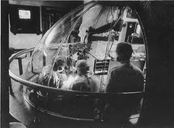
El quirolan, a ple rendiment. El doctor Joaquim Barraquer i Moner.