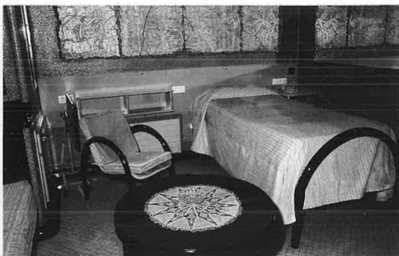
L'escala fa igual com desguassa un lavabo. Interior d'una semisuite .

cionar el problema ocular mentre no s'haurà posat remei a la infecció dental.