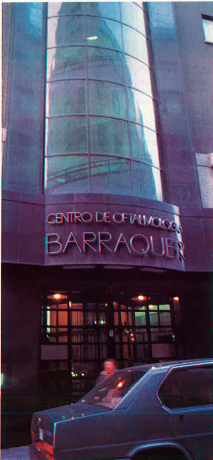
La façana, governada per una vidriera de cristal fumat.

Sobre un esquelet metàl·lic, l'edifici va ser proveït de cambres d'aire i formigó porós a fi d'aïllar-se de la temperatura exterior, ja que, pels mals de què són afectats els pacients, els interns no poden estar a disposició dels rigors meteorològics. La circumstància exigia climatitzar l'immoble, dotar-lo d'aire condicionat —un aspecte revolucionari per al moment de la seua realització— i armar-lo de finestres impracticables i ininterrompudes.