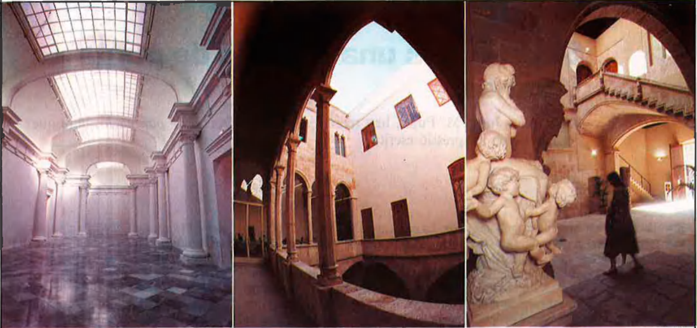
Convent del Carme, palau de l'Almirall i palau del Marquès de l'Escala.