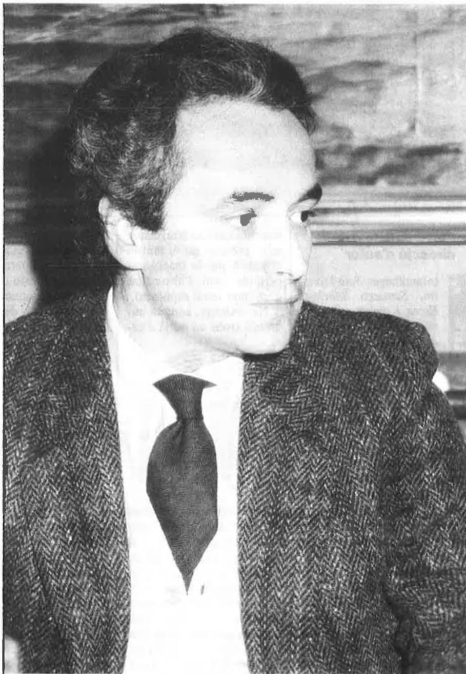
Josep Carreras, primera figura que ha obert el festival.