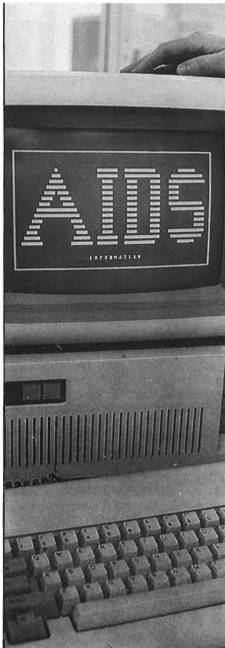
El diari anglès The Independent va ser el primer a donar l'alarma sobre el programa AIDS-Information .

hipòtesi que el disquet contingué algun tipus de virus informàtic o programes destinats a destruir la informació continguda dins l'ordinador. Com a mesura cautelar, un dels especialistes consultats pel periòdic londinenc recomanava no utilitzar el disquet misteriós fins que no s'estigués segur de què podia contenir realment i quins eren els seus efectes. Aquests no van tardar a fer-se evidents.