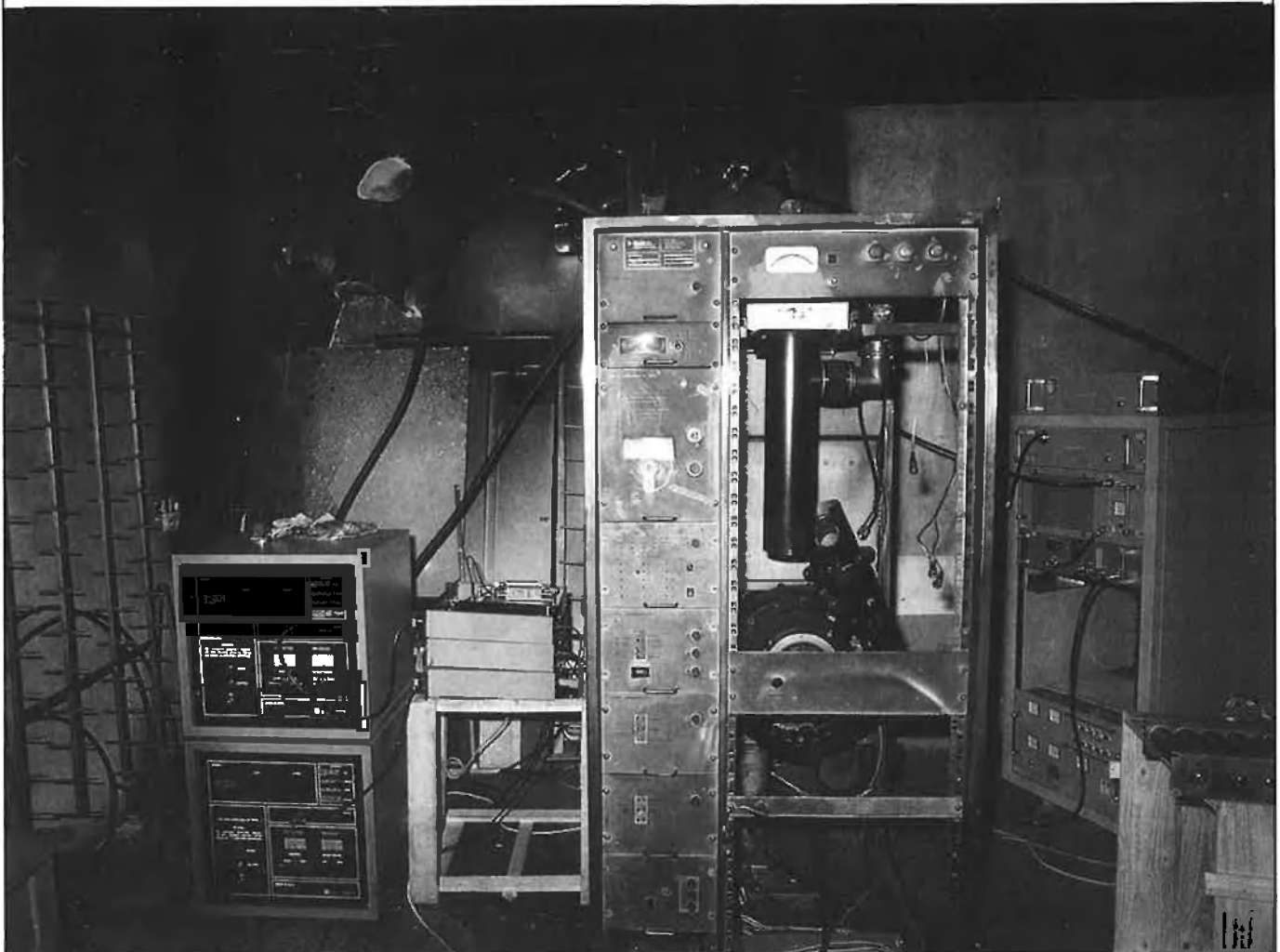
Atemptat contra el repetidor de TV3 a Alfàbia.