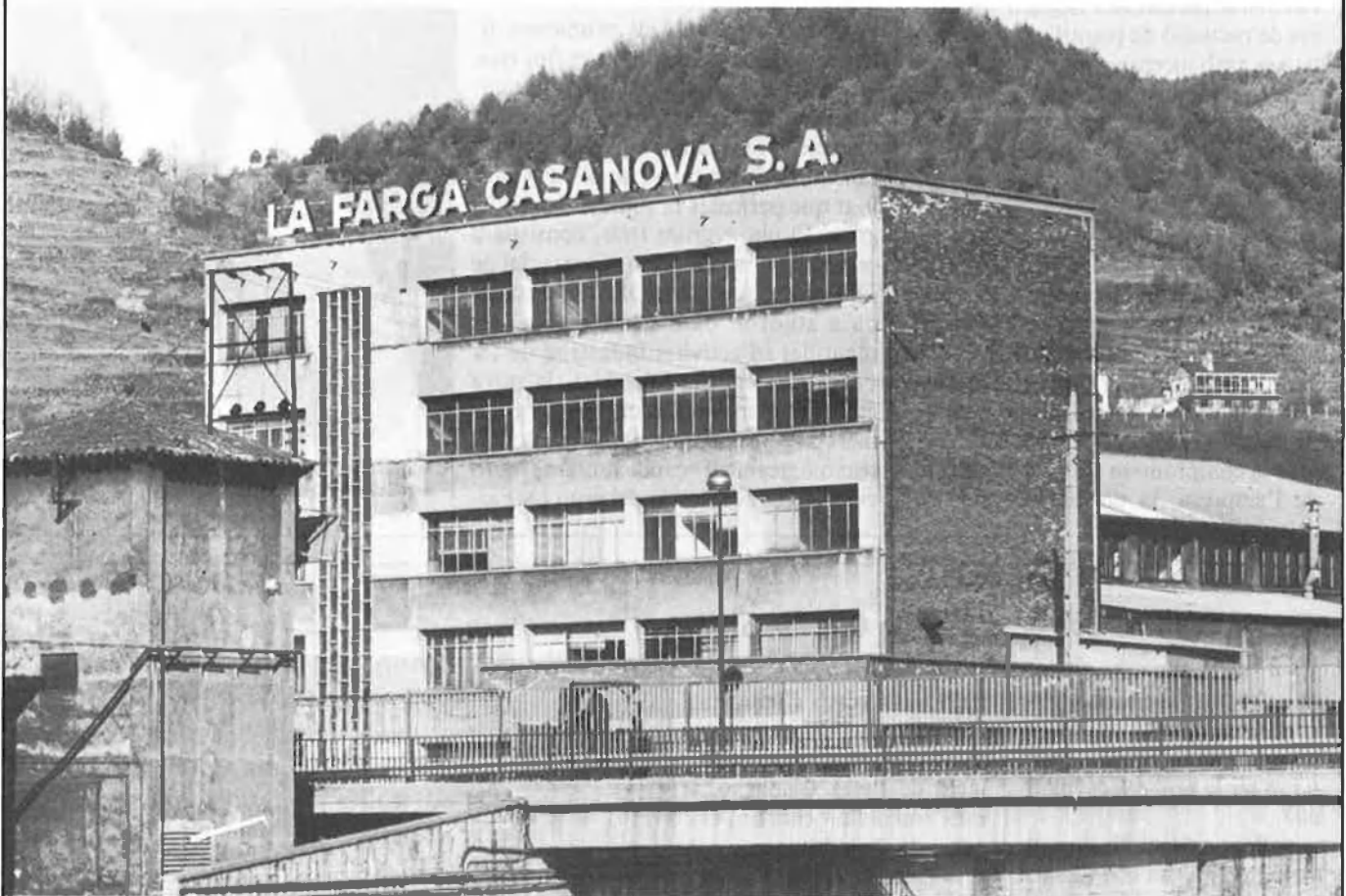
La Farga Casanova, SA.