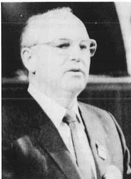
La política de Gorbatxov, segons Kaspàrov, és un fracàs.

—Cada vegada que engegue la televisió, veig el president Bush o qualsevol altre líder occidental dient com està de sorprès per les coses que passen. “¿Qui podia haver-ho imaginat?”, diuen. Bo, ell havia d'haver-ho imaginat, per començar. No pagueu als presidents del EUA perquè se sorpenguen d'unes situacions que han tractat de dur a terme al llarg de 40 anys. Els pagueu perquè estiguen preparats, per això són els líders polítics. Si jo em sorprendria cada vegada que el meu oponent fa un moviment en el tauler d'escacs, perdria. Jo analitze abans que ell tots els moviments possibles que hi puga fer i, llavors, tinc les meves respostes preparades.