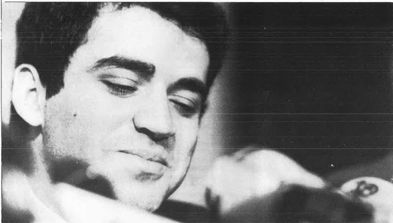
«Gorbatxov és molt més vulnerable des de l'esquerra».