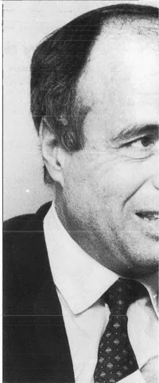
«En infraestructures, crec que les inversions que

Vostè, com a responsable de les forces d'ordre públic, ha estat especialment criticat per l'actuació de la policia durant les mobilitzacions contra la reconversió de Sagunt i, darrerament, amb motiu de les manifestacions dels Serrans contra el