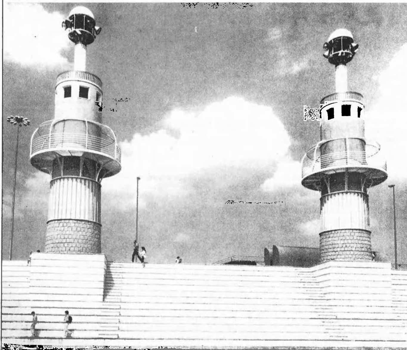
Parc de l'Espanya Industrial, obra dels arquitectes Luis Pena i Francesc Rius.

exemple, de les places dures-places toves), continua desenvolupant-se amb celeritat, de tal manera que una nova Barcelona, la Barcelona de Pasqual Maragall, la Barcelona dels 90, per a bé o per a mal, va configurant-se d'una forma com més va més evident.