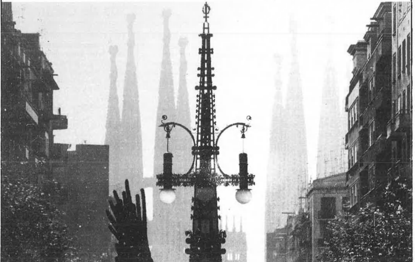
Avinguda de Gaudí. Disseny de les columnes-fanal de Pere Folqués.