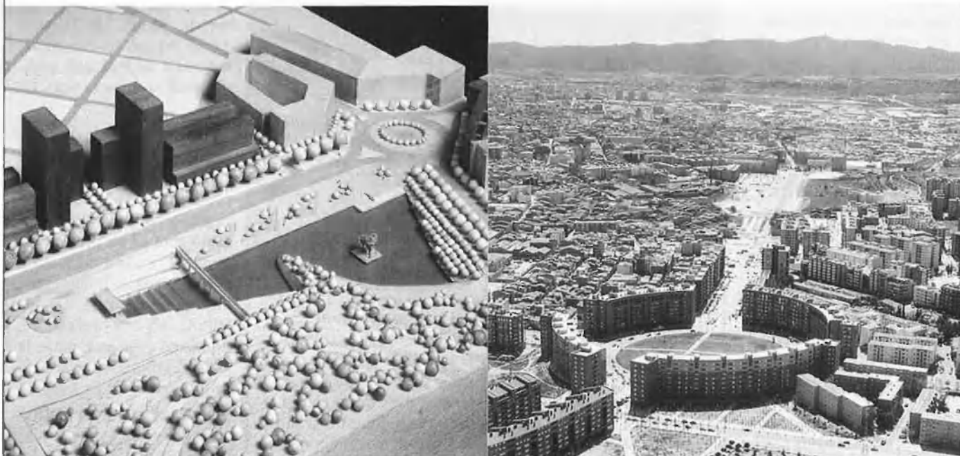
A l'esquerra, maqueta de la zona oficines a la plaça de Catalunya. A la dreta, en primer terme, plaça d'Espanya (vivendes municipals).

creixement de 150 persones més en els propers cinc anys.