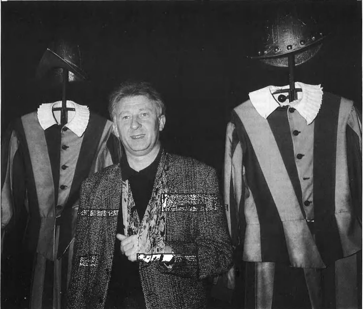
«Amb TVE ha passat que el poder cada dia és més sibil·lí i cada dia n'aprèn més».

Valle-Inclán, o en Calderón, per exemple. I Els Joglars probablement hi tornaran a reincidir. No busquem que els bisbes es posin nerviosos. Em sembla que aquest espectacle el pot veure tothom i el poden veure tranquil·lament els cristians i els creients sense que se'n sentin ferits.