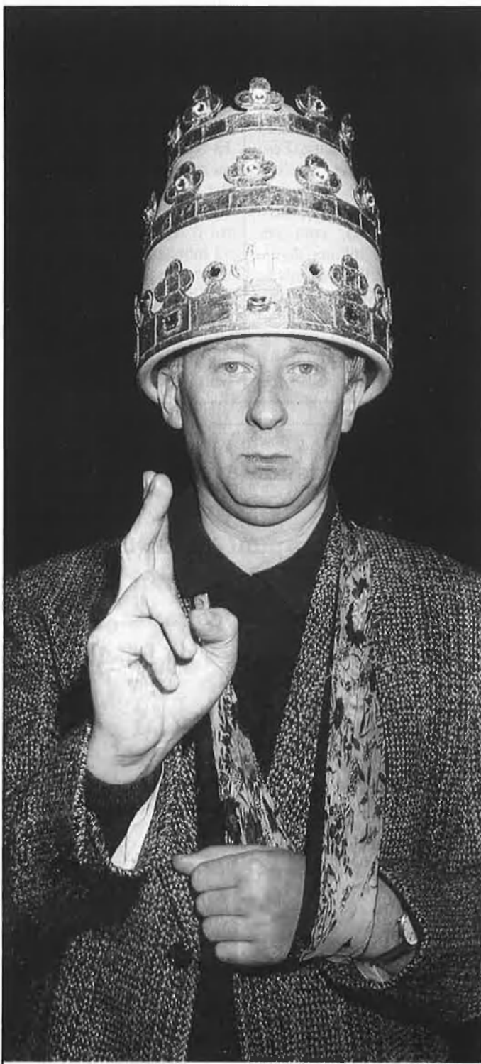
«L'oposició d'aquest país fa riure».