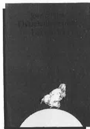
ELS TREBALLS PERDUTS JOAN F. MIRA