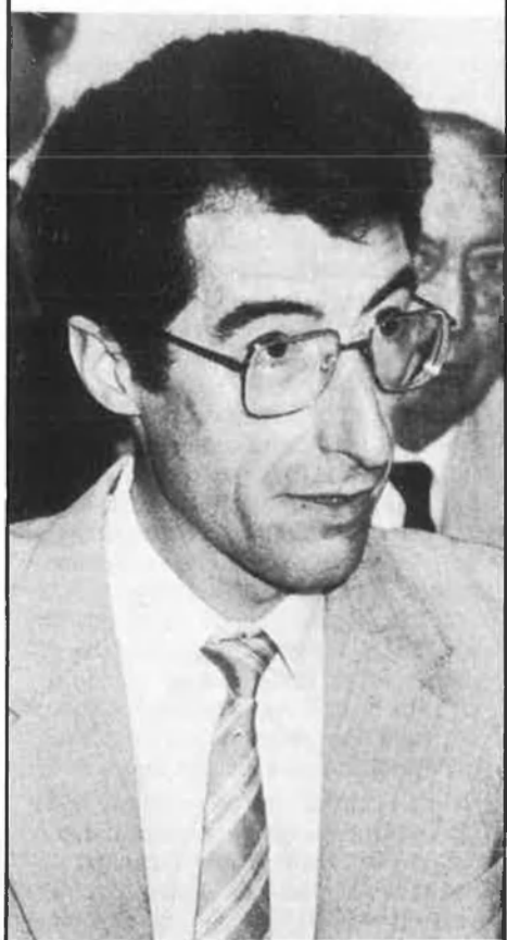
J. Becat (1941) P. Verdaguier. Perpinyà en l'espai català.