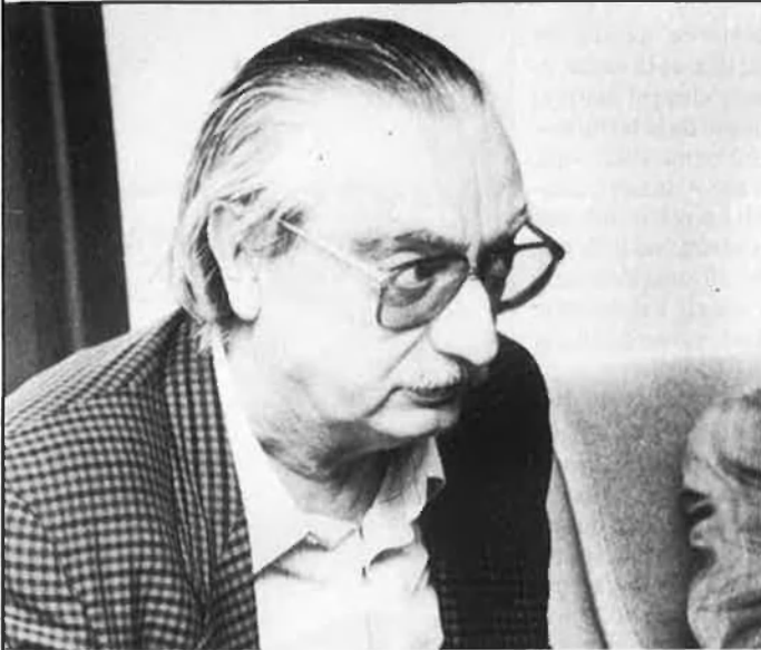
Joan Fuster (1922). Voltaire i la nació: «Ser valencians és la nostra manera de ser catalans».