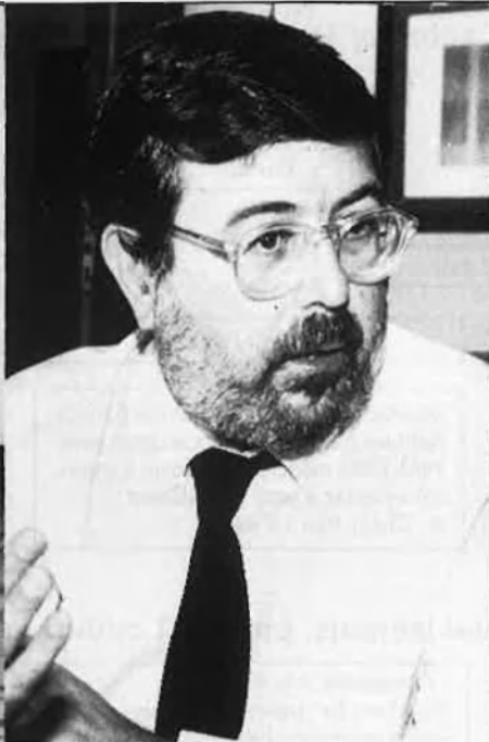
A. Cucó (1941). Nosaltres els valencians: societat civil i política de vertebració nacional.