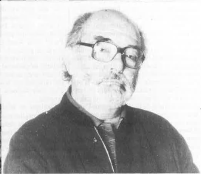
V. Ventura (1924). Del carlisme als GARS: el marxisme com a referent per a un model nacional.

cació, es tractava de fer cultura nacional.