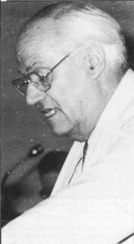
A. Cirici (1914-1983). «Els mots 'catalanista' i 'catalinisme' són propis d'un subdesenvolupament de les perspectives» (1973).