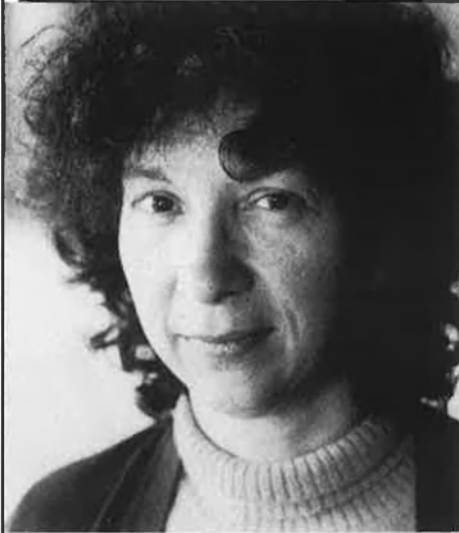
E. Serra (1942). Història Nacional i compromís polític... maulets contra botiflers.