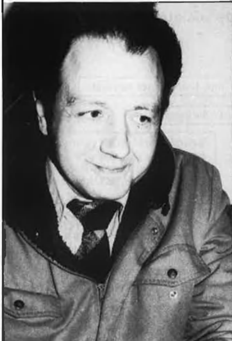
L. V. Aracil (1940). Del dilema valencià i del mite bilingüista.