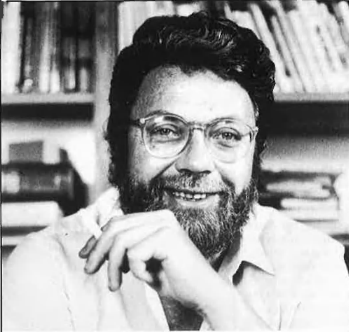
J. V. Marqués (1943). Anàlisi de la ideologia de la consciència fosca.