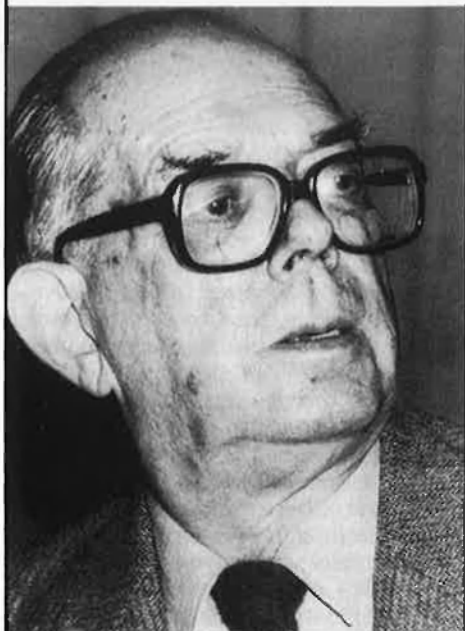
P. Vilar (1903). Països Catalans: lluita de classes, models culturals i estructures socio-econòmiques.