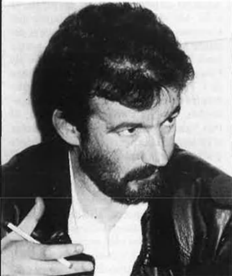
V. Pitarch (1943). Destinat (sobretot) a araciians: contra la substitució lingüística.

trevista a Ignasi Riera i el llibre de R. Ribó: Sobre el fet nacional: Catalunya, Països Catalans, Estat espanyol , (1977).