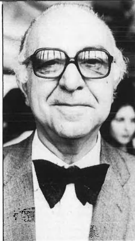
Manuel Sanchis Guarner (1913-1981). Els pobles del Paísos Catalans parlen els uns als altres.