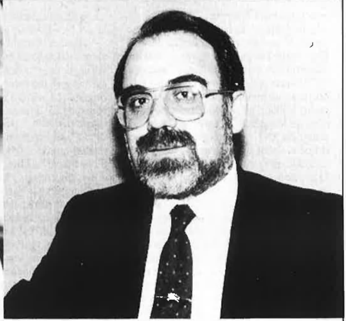
V. Franch (1949). Fer del País Valencià una nació.

interessos de les classes populars. Aquesta historiadora és autora d'un article a Serra d'Or (a propòsit dels Països Catalans), on pensava en la importància geopolítica del País Valencià durant la transició pel que feia a la seva progressiva espanyolització. I en les jornades dedicades a reflexionar sobre els Països Catalans, celebrades a Ciutat de València pel 1984, proposava un model històric dels Països Catalans a fi de pensar-los no com a blocs oposats sinó amb grans relacions (p. exemple: exposava el cas del que va suposar el s. XVIII arran del 1707 o 1714 com a reacció a un «bloc feudal hispànic» articulat al segle XV en ocasió del Compromís de Casp...): «La història interna dels Països Catalans no es pot entendre sense tenir en compte la formació del poderós bloc feudal hispànic al sud-oest i la del poderós bloc feudal francès pel nord».