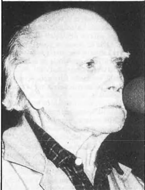
J. Renau (1907-1982). ¡Bandera! ¡Poble! ¡Nació!... Marxisme nacional.

J osep Termes, a les jornades que tenien per objectiu pensar sobre els valencians i la qüestió nacional (1983), atorgava un paper rellevant als intel·lectuals com a legitims i constructors de mites. Hi deia, entre d'altres coses, que «als Països Catalans hi ha una base potencial per a bastir una cultura molt sòlida, dirigida per aquest motor Barcelona-València, potenciada a més per les capitals de comarques i ciutats mitjanes.