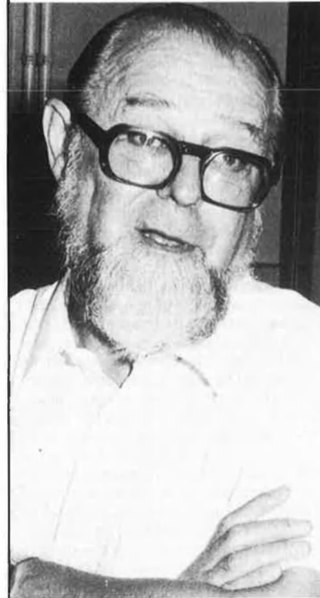
J. Carbonell (1924). «Que la prudència faci traïdors».