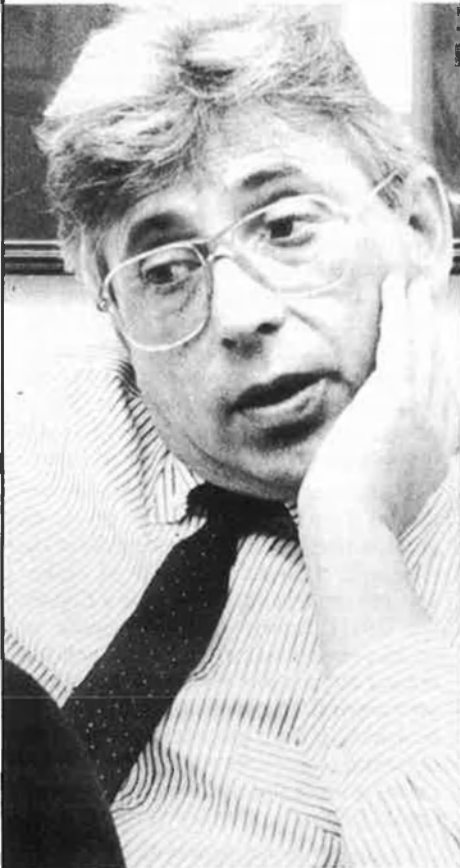
Raimon (1940). Gramsci, Països Catalans: ¡Al Ventl.

ter geofísic (el que ocupa la llengua), demogràfic (densitat de població), cultural («homogeneïtat comunitària»), polític (poder) i informatiu (espai comunicacional).