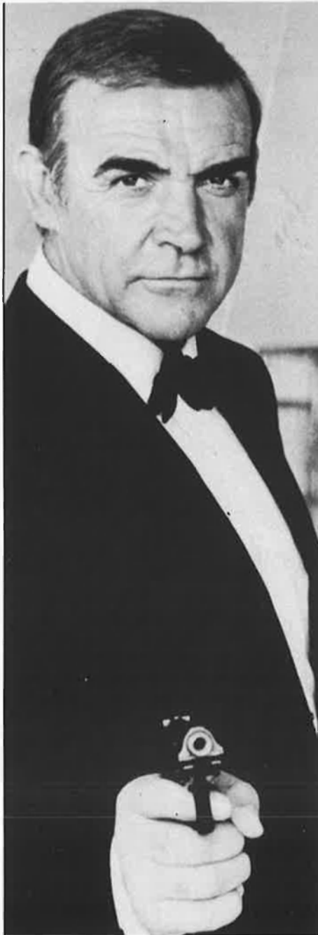
Sean Connery, el James Bond més popular de la història del cine.

CHANDLER: «¿Com t'ho fas per escriure tants llibres amb tots els compromisos que tens?».