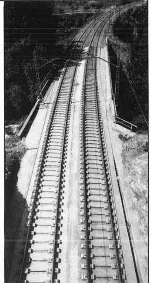
Les infraestructures ferroviàries, clau en la construcció

Entre les Regions Europees de Tradició Industrial (RETI) més ben situades hi ha Hamburg (140 punts), Bremen (128), el