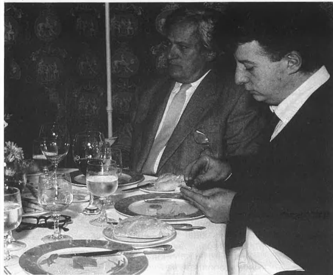
per la nostra redacció.

Oriol Bohigas: «L'única cosa que ha aconseguit aquesta revista és que abans semblava un full dominical, cosa que a mi m'agradava, i ara sembla una revista com totes les altres».