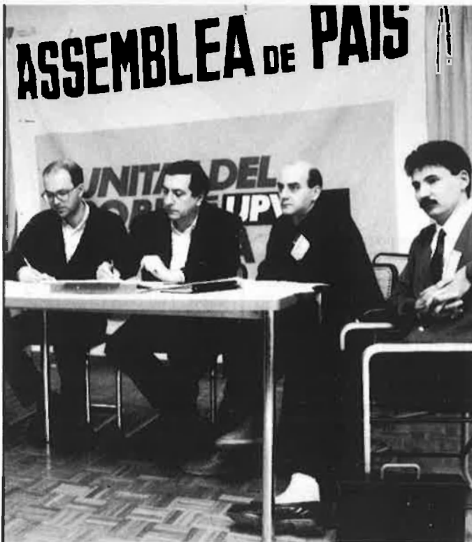
UPV, massa poc definida.