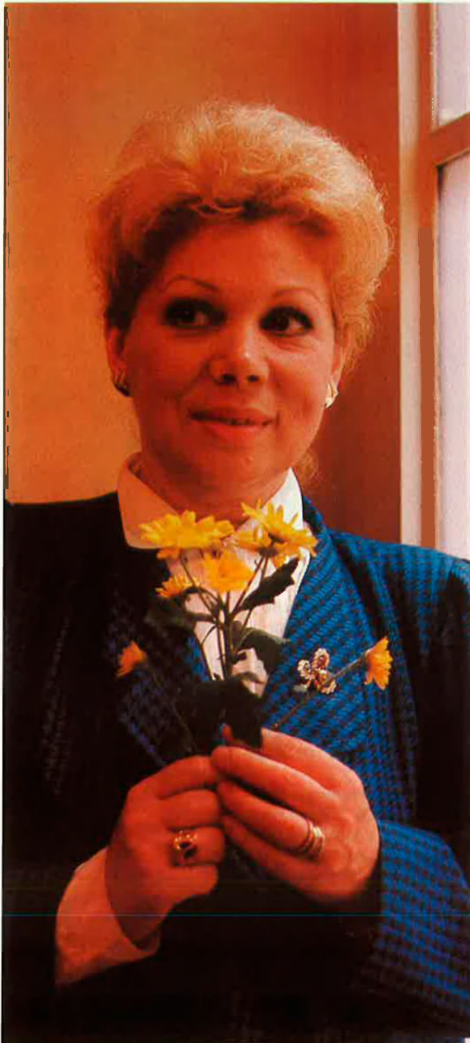
«Utilitzar bé el cervell» és una frase que sol fer servir sovint.

—Sempre m'ha agradat el cant i l'òpera. La meua mare em conta que quan jo tenia dos anys, deixava el que estava fent si sentia cantar òpera a la ràdio. És una cosa que porto dins i que, gràcies a Déu, m'ha servit per a poder fer en la vida allò que tant vull.