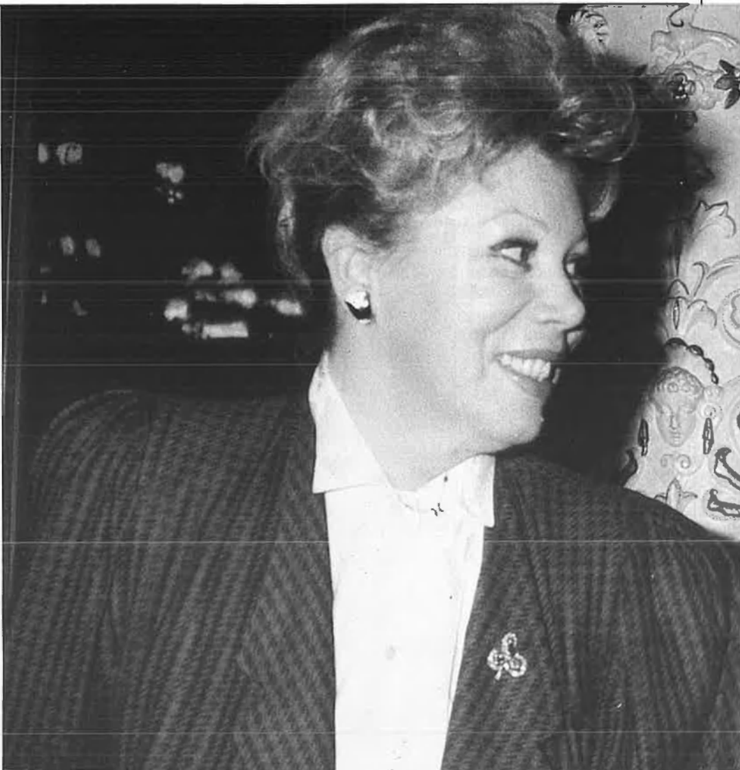
Mirella Freni i Plácido Domingo.

bé. No estar bé en escena és més disculpable perquè el públic va al teatre per a escoltar la veu, i quan s'ha cantat bé, n'ix content. Ara bé, és clar que la felicitat màxima es produeix quan tot ha marxat perfectament.