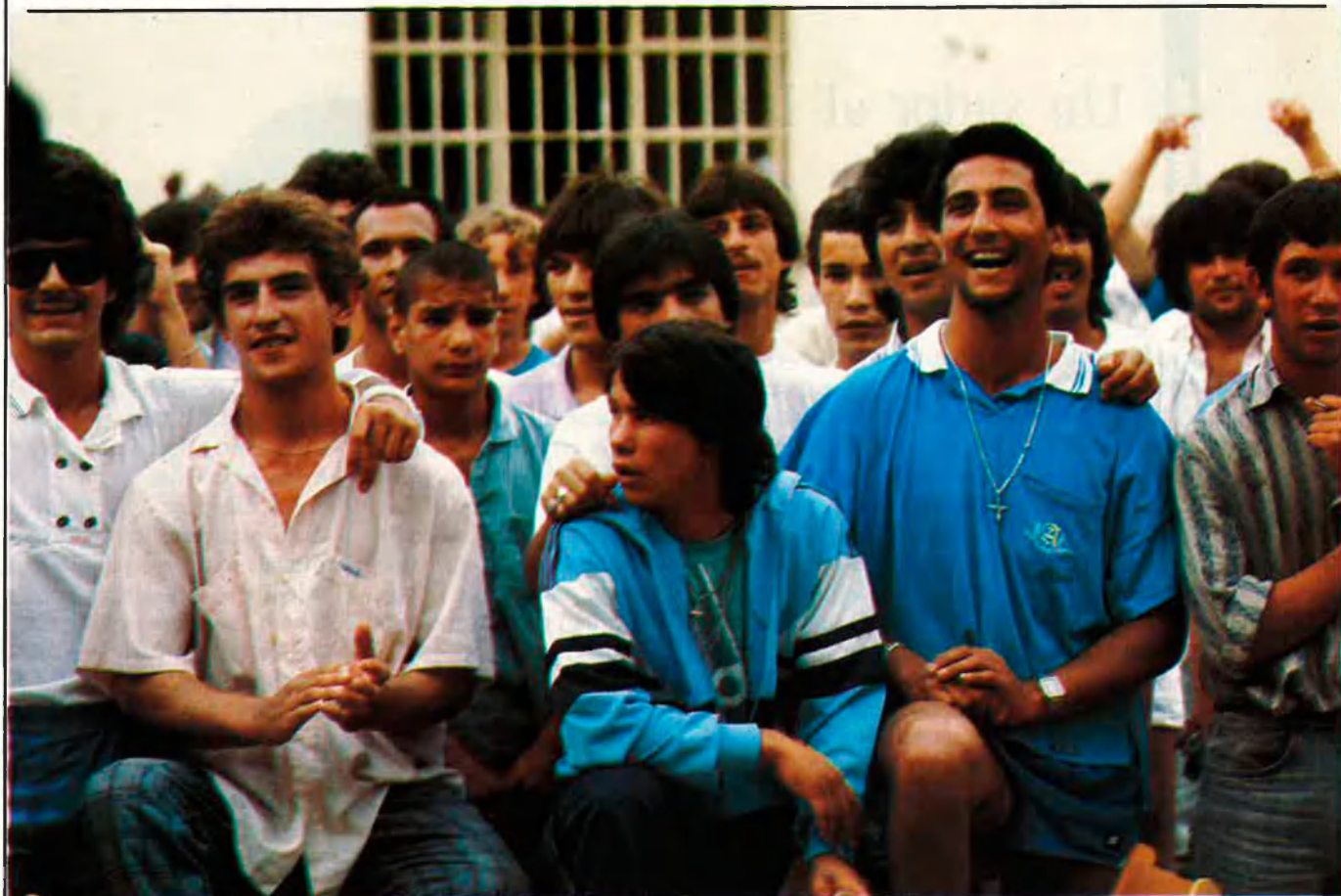
La presó dificulta el desenvolupament de la vida sexo-afectiva de les persones.