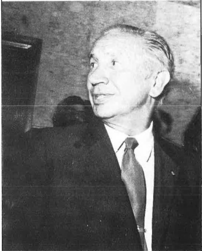
Joan Antoni Samaranch.

La nova entitat hauria de continuar i potenciar la política d'expansió que ja havien emprès les dues caixes. En aquest sentit, cal destacar les 1.200 oficines que La Caixa tenia previst obrir fo-