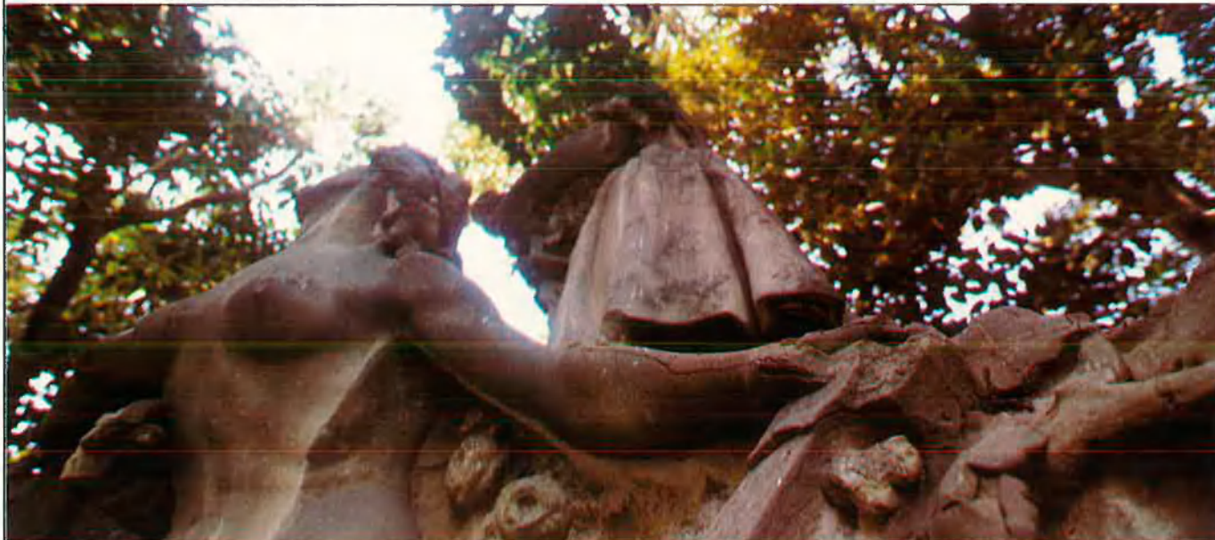
Monument a Teodor Llorente.