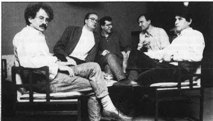
La representació ponentina, a l'aguait.

i el subsidiari d'altres mitjans centren el debat.