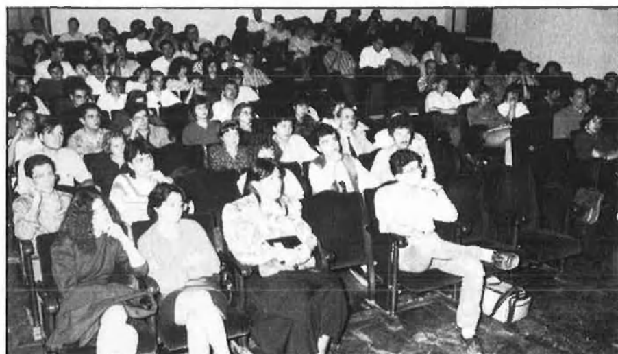
Les taules rodones van comptar amb un bon nombre d'assistents.