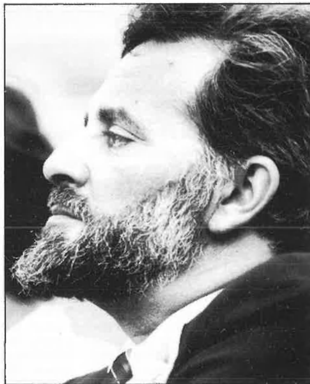
Anguita: la demostració dels vasos comunicants.