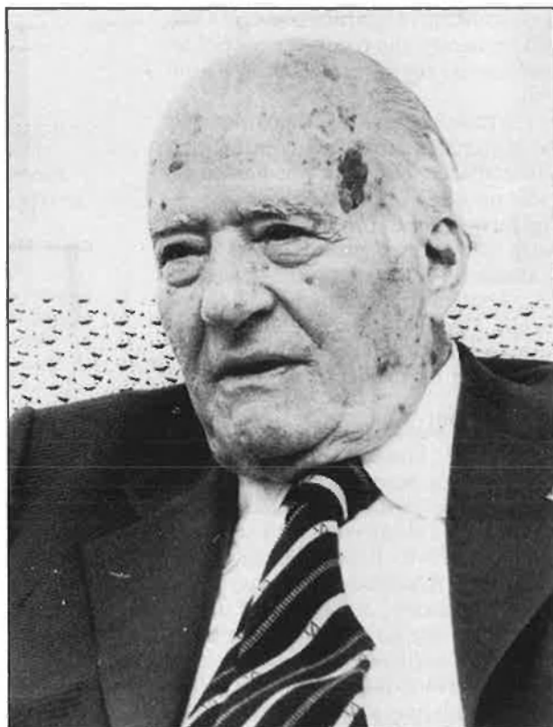
Josep Tarradellas, el president nomenat pel BOE.