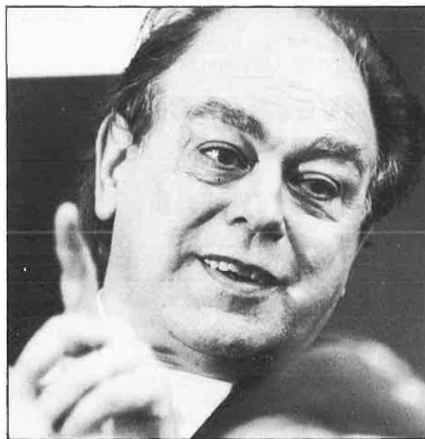
Jordi Pujol, inclinat pel balanç positiu.