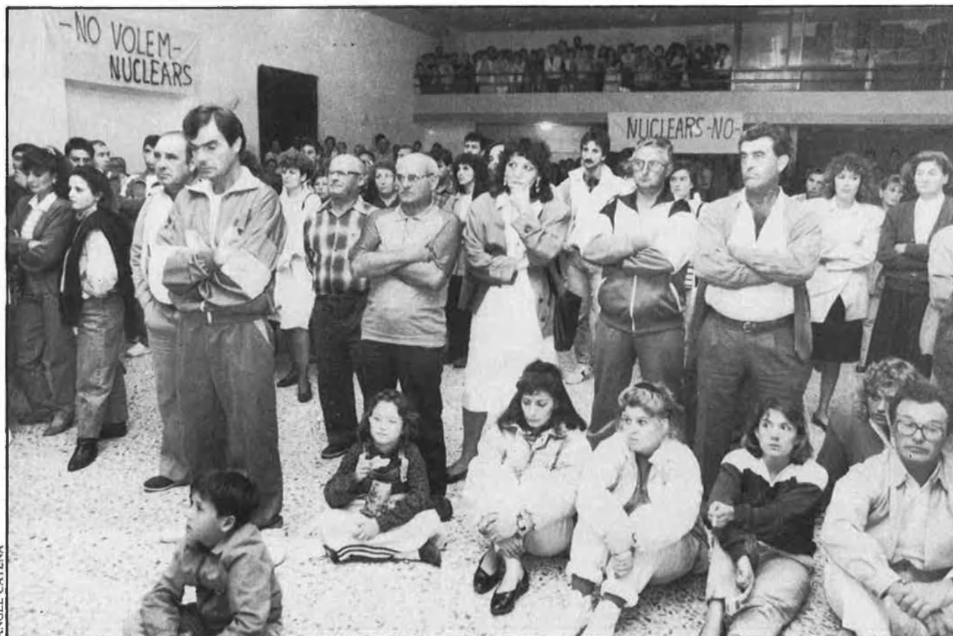
L'Ametlla de Mar. Assemblea en la qual els veïns d'aquest poble demanaren el desmantellament dels grups nuclears de Vandellòs.

26 ENTITATS TARRAGONINES DEMANEN LA IMMEDIATA PARALITZACIÓ DE VANDELLÒS