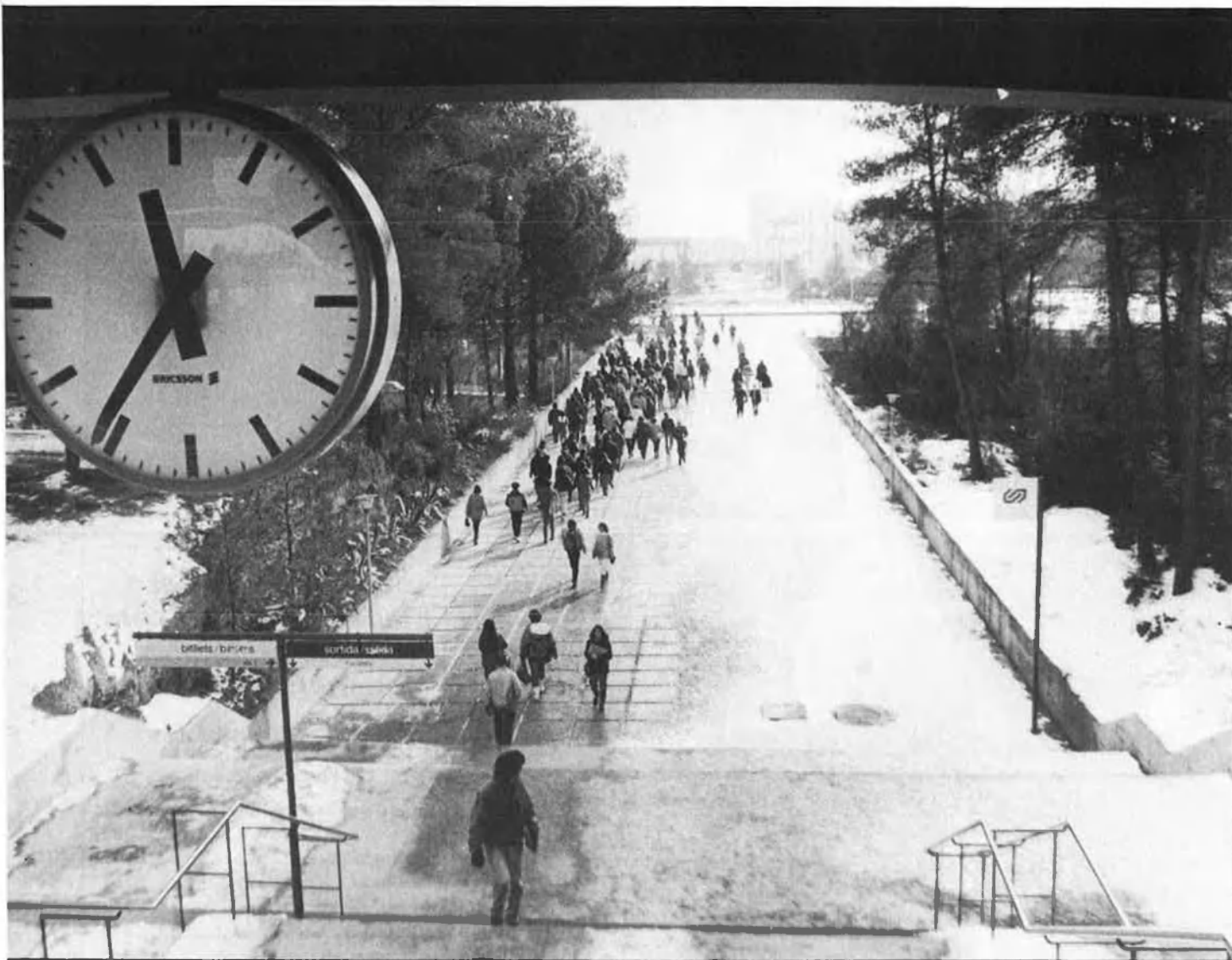
A Catalunya hi ha el projecte d'una universitat privada, promoguda, entre altres, per ESADE i els Jesuïtes.

ves especialitzacions, en funció de les necessitats socials i laborals del moment.