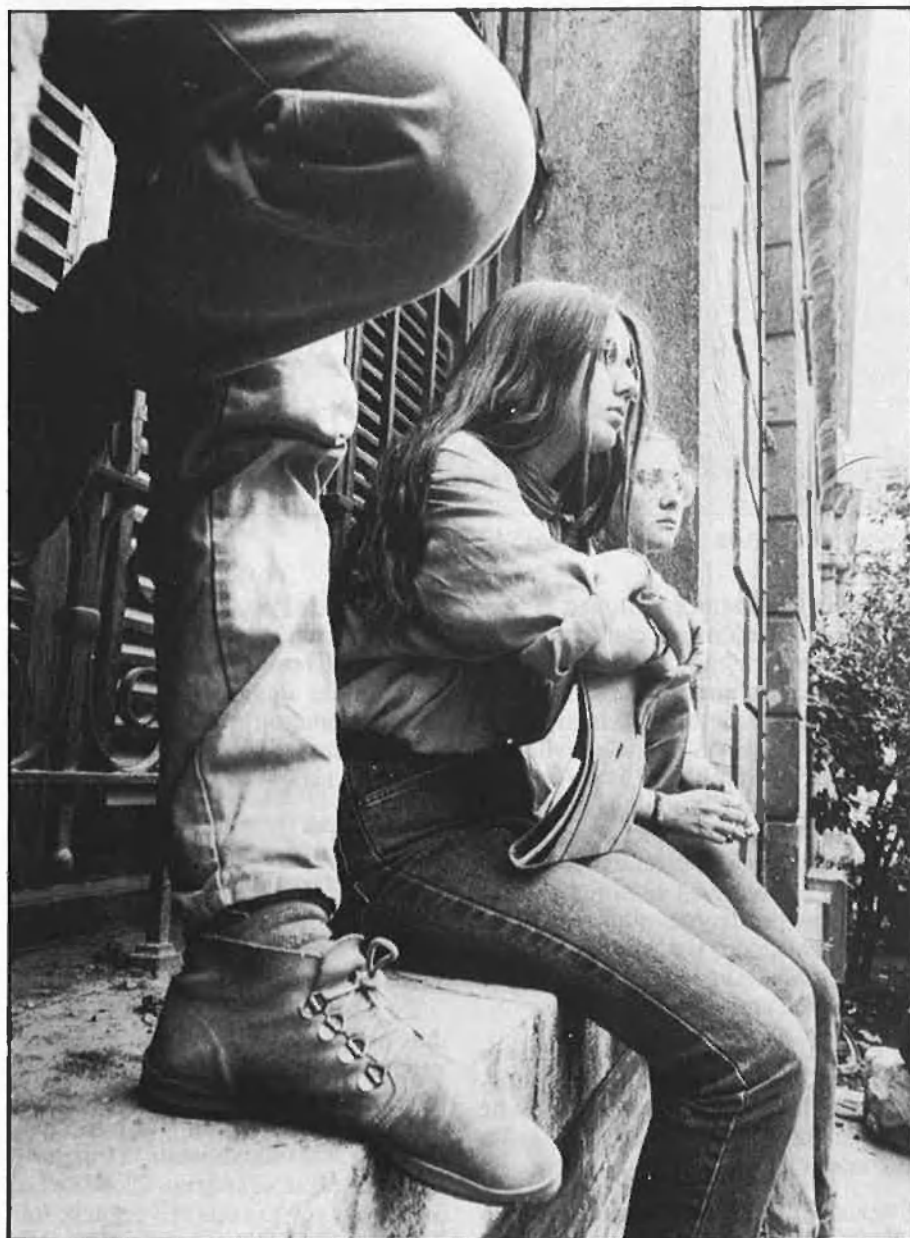
Massificació o numerus clausus, la Universitat es troba en un atzucac.