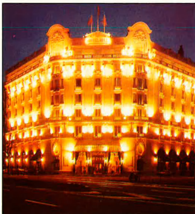
Els hotels catalans, un 50% més barat que a la resta d'Europa.