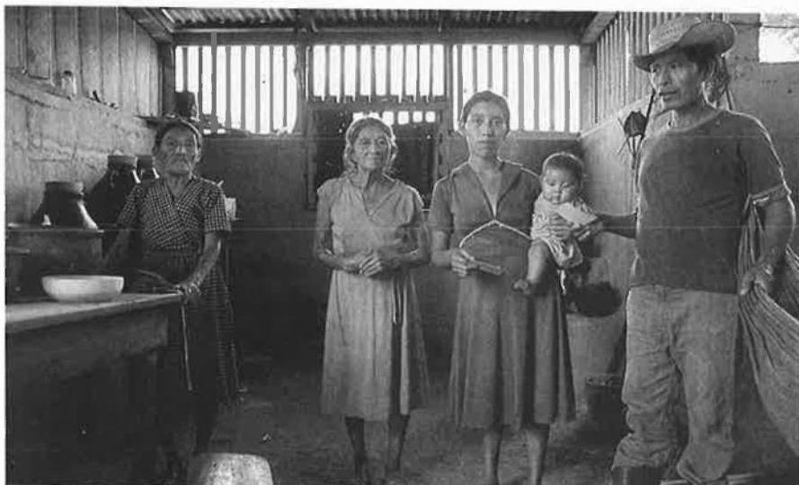
Els països industrialitzats han aconsellat amb cinisme estranyer la bossa.

La idea que els bancs privats dels països industrials haurien de contribuir a la reducció del deute dels països en vies de desenvolupament, té el seu origen en els polítics que assistiren a la cimera. El president del Deutsche Bank,