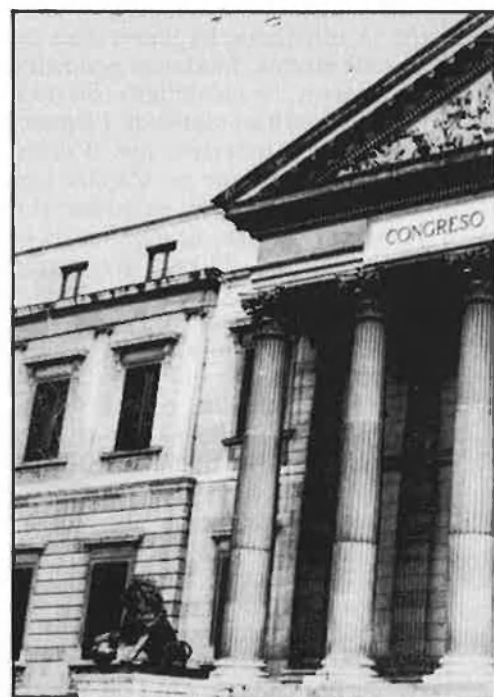
Congrés dels Diputats, àrea privada dels partits