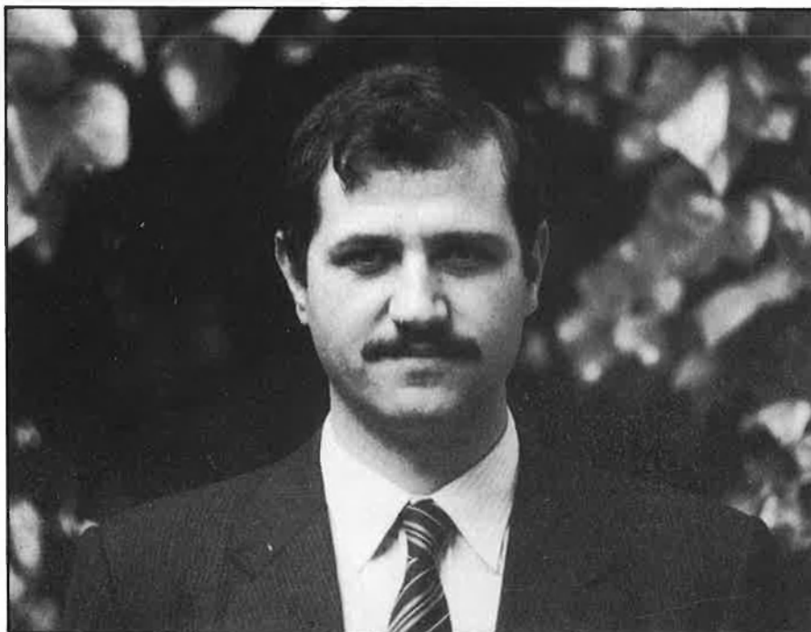
Mateu Morro, secretari general del Partit Socialista de Mallorca.

amb el sistema electoral espanyol, que afavoreix només els partits majoritaris, l'esquerra nacionalista es veu abocada a la marginalitat o a l'extraparlamentarisme.