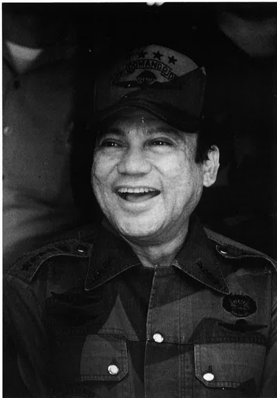
Noriega només compta amb el suport d'una part de l'exèrcit.

havia de pronunciar un discurs davant l'Assemblea General de les Nacions Unides. Rodríguez no obrí la boca durant les cinc hores de confusió; solament exterioritzà el suport a Noriega quan es confirmà que els sublevats havien perdut la batalla. El detall és simptomàtic de la desconfiança de Rodríguez envers qui l'entronitzà fa menys de dos mesos.