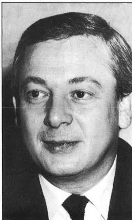
Carlos Solchaga haurà de modificar impostos davant la pressió de tots.

La disminució en la recaptació a la Seguretat Social condicionaria aquestes modificacions que es veurien reequilibrades, segons la coalició de José María Aznar, amb una