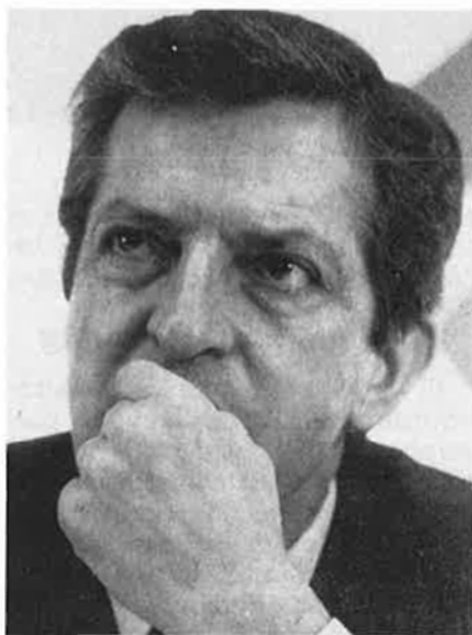
CDS: Premiar l'estalvi.

La deducció tributària fiscal per segona vivenda i successives ha de desaparèixer, i els amos de vivendes en propietat desocupades han de ser, segons EU, penalitzats. Els béns i els serveis de primera necessitat han de tenir un IVA de tipus reduït, i el frau s'ha de combatre, entre d'altres maneres, per mitjà de «la urgent elevació de les plantilles dels inspectors d'Hisenda».